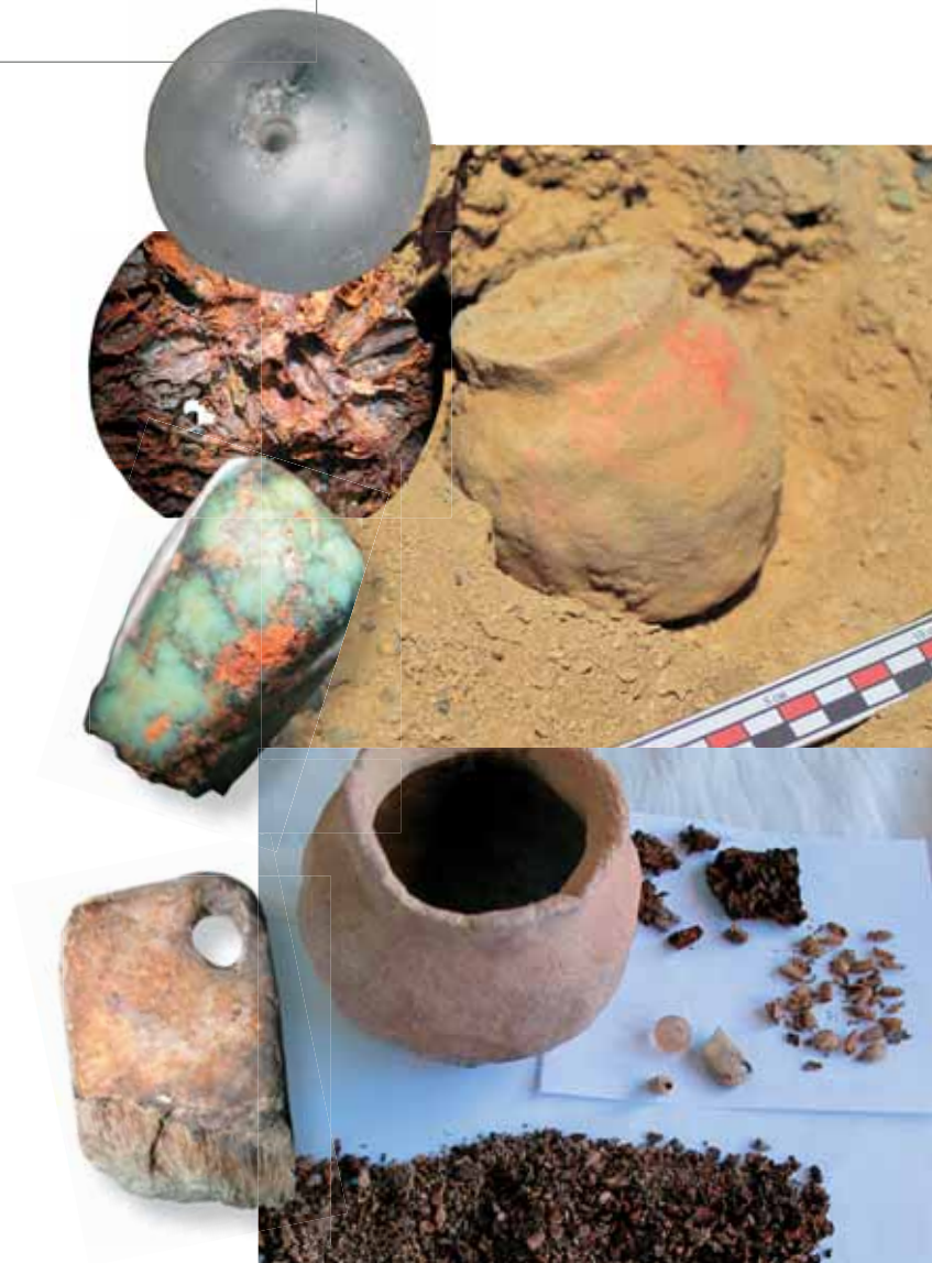
Сосудик, обнаруженный возле камня с изображением Тары in situ . Внизу: сосудик и его содержимое: бусина из горного хрусталя, бирюзовая вставка, металлическая пластина – украшение, костяная подвеска.

Происхождение рода весьма символично: предок племени тёлёс был женат на мифическом существе, так называемой алмыске. Родоначальником стал мальчик, родившийся от этого союза, которого назвали Алмат. Мифическая прародительница рода алмат – алмыска – относится к существам, живущим в курганах. По легенде, в сумеречное время они выходят из кургана в виде козленка или козы. Если разрушить курган, алмысы преобразуются в духов войны и на земле начинаются кровопролития и стихийные бедствия (приведенные сведения любезно предоставлены д. и. н. Е. Ямаевой). В 90-е гг. решением народного схода с. Кулада были запрещены археологические раскопки самых