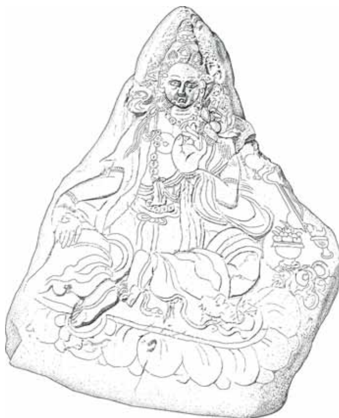
Камень с изображением богини Тары. Прорисовка изображения на камне. Рисунок Азиза Салиева

Сейчас камень явно используется в каких-то пастушеских культах, свидетельством чего служат приношения в виде огромной кучи рогов домашних и, частично,