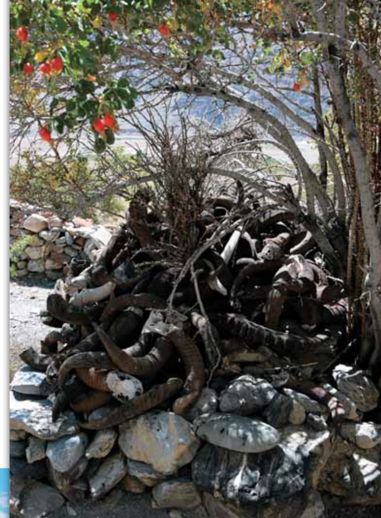
Святилище с рогами животных. На пути в Занскар – долина реки Суру

тканях, архитектуре и о многом другом. Сохранить этот уходящий мир если не в реалии, то хотя бы в видеоматериалах и описаниях, фото и рисунках, книгах и статьях – важнейшая задача, которая не терпит отлагательства.