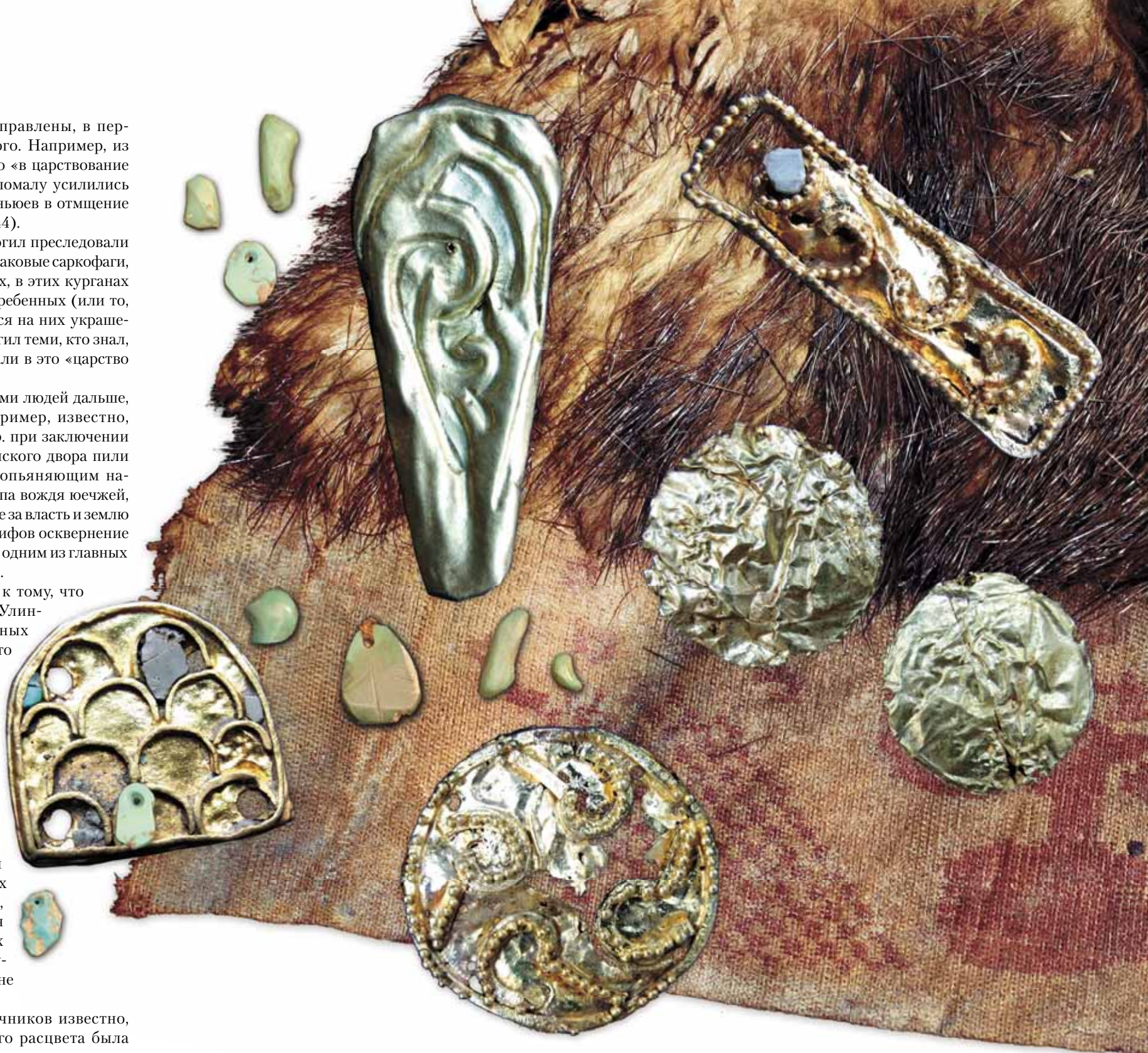
Из погребальной камеры 20-го кургана Ноин-Улинского могильника хунну, расположенной на глубине 18 м, были извлечены многочисленные предметы, сопровождавшие умершего в загробный мир. Среди них – украшения из золота и бирюзы, остатки шелковых и шерстяных одежд