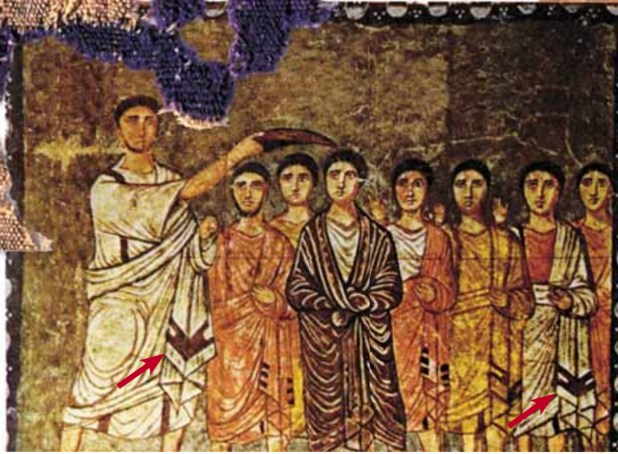
Миропомазание Давида. Стенная роспись синагоги в г. Дура-Европос. По: (Шлюмберже, 1985). Красными стрелками показан зубчатый орнамент на одеждах, совпадающий по рисунку с уцелевшим фрагментом орнамента на шерстяной ткани, найденной при раскопках в Пальмире

Первое, что выяснилось, – это был не «он», а «она». Об этом, во-первых, свидетельствовала грацильность, т. е. отсутствие массивности зубочелюстного аппарата. Судя по стертости зубов, она была молода – 25–30 лет. Женщина, бесспорно, принадлежала к большой европеоидной расе, а именно к тем ее антропологическим вариантам, которые относятся к южному грацильному одонтологическому типу.