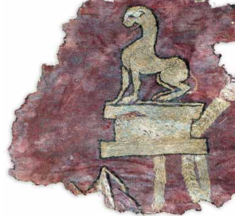
Расшитая шерстяная завеса из 20-го Ноин-Улинского кургана