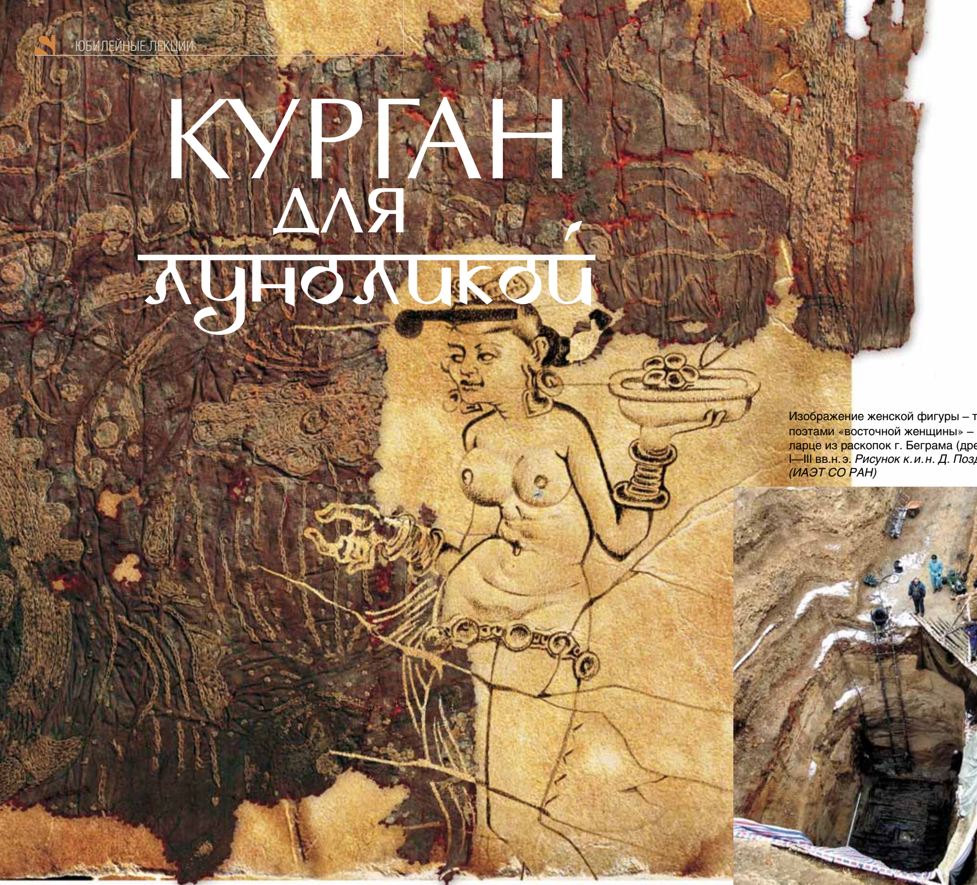
Изображение женской фигуры – типичной, воспетой поэтами «восточной женщины» – на резном костяном ларце из раскопок г. Беграма (древ. Каписа). I–III вв. н. э. Рисунок к. и. н. Д. Позднякова (ИАЭТ СО РАН)