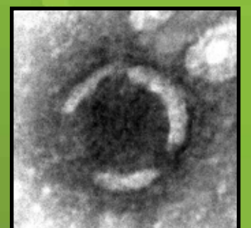
Электронная микроскопия.