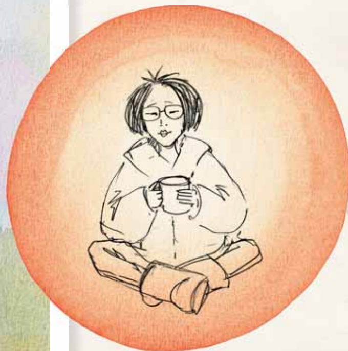
Рисунки Анастасии Абдулмановой

разорявшие погребальные комплексы не из меркантильных, а из мистических соображений.