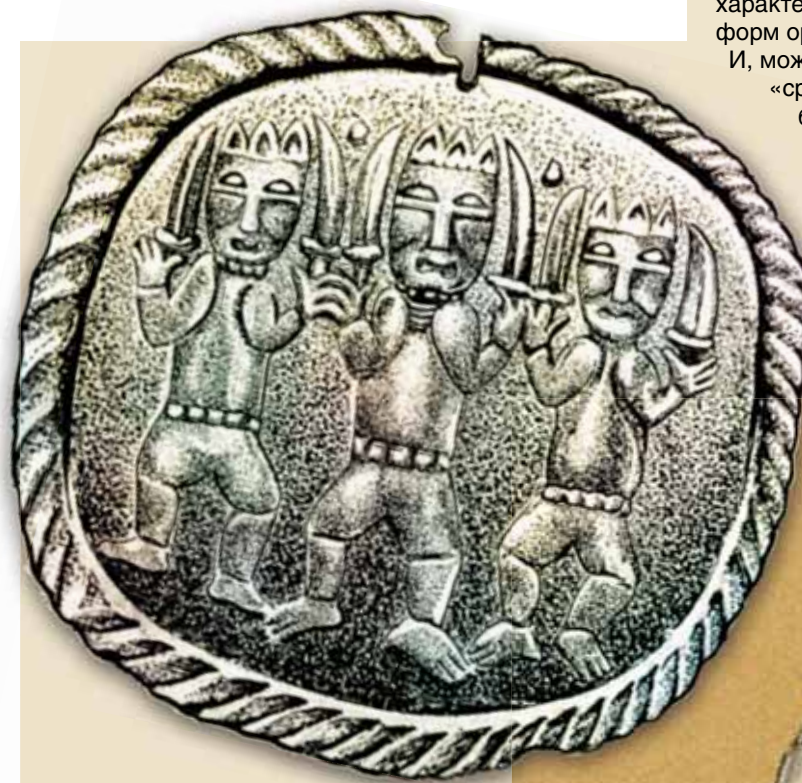
Бляха с Шайтанского мыса

Военный предводитель монгольского войска. Его лицо закрыто железной полированной маской. Не секрет, что монгольская оружейная экипировка стали служить образцом для подражания почти на всей территории Азии и Востока. Причем еще долго воспроизводились и усовершенствовались уже после исчезновения самих монголов с подвластных территорий, в том числе мастерами тех земель, где собственно монгольских отрядов никогда и не было. Факт знакомства западносибирских таежников с монгольской военной техникой не вызывает сомнения. Слишком много характерных типов наконечников стрел и других форм оружия найдено на этой территории. И, может быть, знакомство с подобными «среброликими» военными предводителями было еще одним толчком к распространению обычая обивать металл лица особо почитаемых изваяний богатырей-предков. Рис. Д. Позднякова