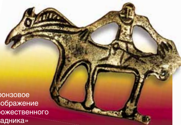
Бронзовое изображение «божественного всадника» Мир-сусне-хума

Оказывается — самое непосредственное. Обращаясь с высоты сегодняшнего дня к тем временам, можно заметить, что таежный мир выглядит неким очагом стабиль-