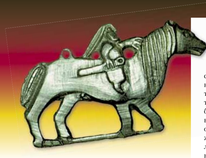
Дух-покровитель со средневековой бронзовой личиной из пос. Зеленый Яр. Фото А. Бауло

Среди прекрасных археологических находок, сделанных в последнее время уральскими коллегами, наряду с бронзовыми образками встречаются и замечательные «портреты», вырезанные из дерева. Они практически тождественны своим металлическим «собратьям», но закреплялись на небольших куколках, собранных из кусочков меха, ткани и человеческих волос. Ясно, что «священного металла», каким с незапамятных времен считалась в тайге бронза, на всех не хватало, и отлитые из него персоны в силу необычных свойств материала могли иметь особый сакральный смысл и, скорее всего, принадлежать людям выдающимся. Соответственно, бронзовые личины предполагали весьма долговременное, если не вечное хранение, что, по разумению древних, было необходимо для жизнеобеспечения и выживания популяции.