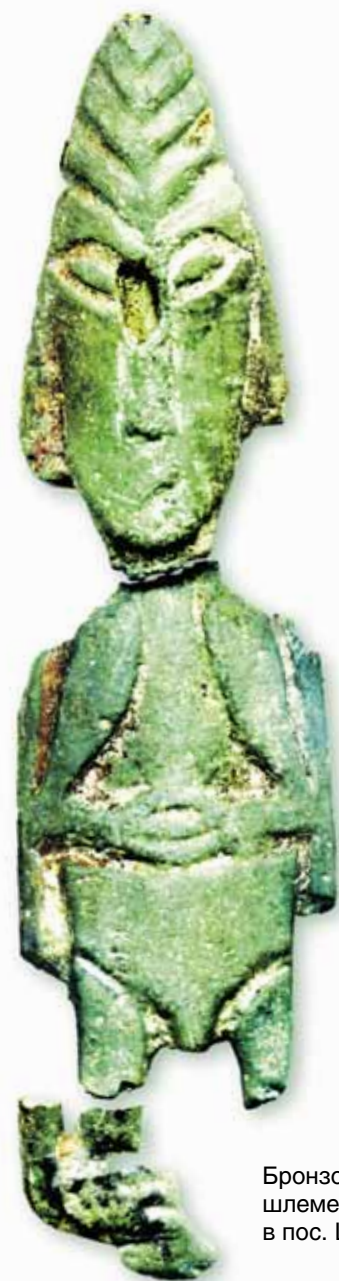
Бронзовая фигурка в «пятирядном» шлеме, обнаруженная А. Бауло в пос. Шурышкары.

А теперь обратимся к находкам, сделанным близ небольшого озера на правом берегу реки Суйги — левого притока реки Кети, на окраине поселка Рыбинское. В их числе — выразительная фигурка человека со стилизованным туловищем и тщательно смоделированной головой в островерхом головном уборе, в котором легко узнается приземистый боевой шлем, состоящий из цилиндрической тульи и низкого конического верха. Похожие предметы воинской экипировки известны и в европейской изобразительной традиции. Аналогичный убор венчает голову фигуры «верхо-