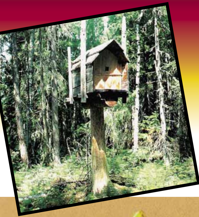
Культовый амбарчик с изваяниями менквов-сторожей.