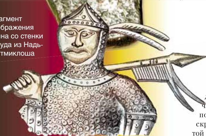
Фрагмент изображения воина со стенки сосуда из Надь-сентмиклоша

вого воина, влекущего за волосы пленника», отчеканенного в медальоне на стенке золотого кувшина из так называемых Сокровищ Аттилы — клада VII—IX вв., обнаруженного в 1799 г. в Венгрии.