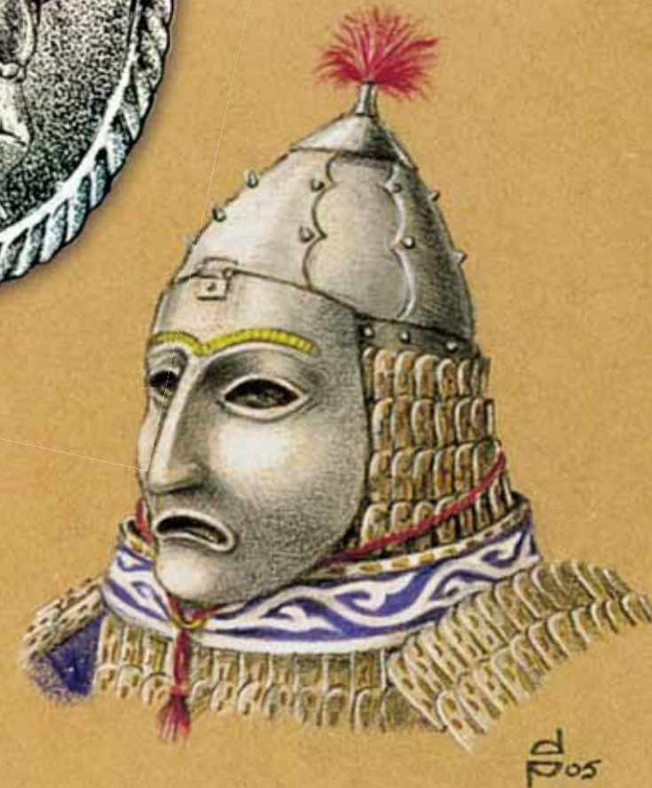
В статье использованы рисунки и фотографии автора

Военный предводитель монгольского войска. Его лицо закрыто железной полированной маской. Не секрет, что монгольская оружейная экипировка стали служить образцом для подражания почти на всей территории Азии и Востока. Причем еще долго воспроизводились и усовершенствовались уже после исчезновения самих монголов с подвластных территорий, в том числе мастерами тех земель, где собственно монгольских отрядов никогда и не было. Факт знакомства западносибирских таежников с монгольской военной техникой не вызывает сомнения. Слишком много характерных типов наконечников стрел и других форм оружия найдено на этой территории. И, может быть, знакомство с подобными «среброликими» военными предводителями было еще одним толчком к распространению обычая обивать металл лица особо почитаемых изваяний богатырей-предков. Рис. Д. Позднякова