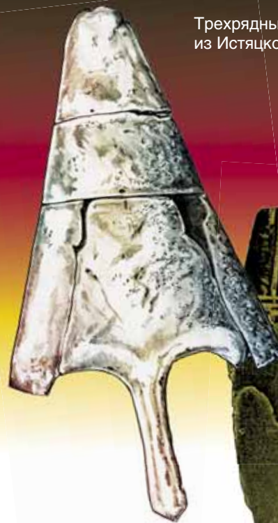
Трехрядный шлем из Истяцкого клада