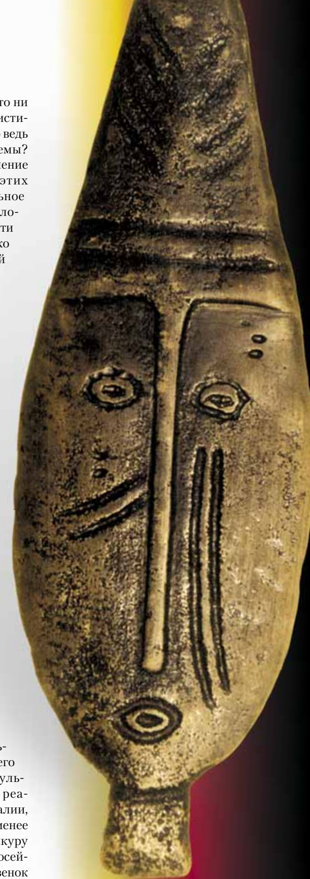
Бронзовая личина в многорядном шлеме, обнаруженная на берегу р. Парабель. Томский областной краеведческий музей

Во все исторические эпохи своеобразным «социальным паспортом», знаком отличия персоны