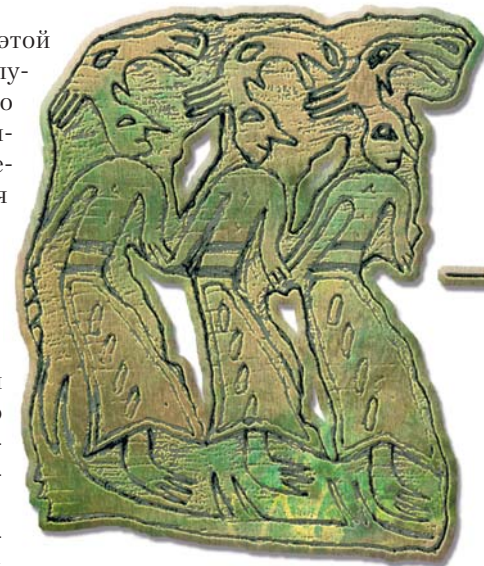
На «тропе мертвых». Бронза. Середина I тыс. н.э. (Пермская губ.)