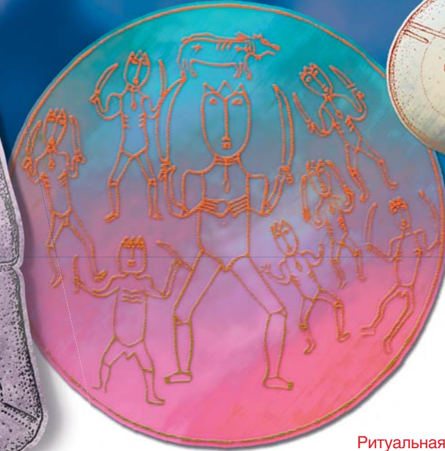
Ритуальная пляска обско-угорских воинов. В центре — фигура богатыря-военачальника. Гравировка на дне серебряного ковш. Вторая половина I тыс. н.э. Коцкий городок (Тобольская губ.)