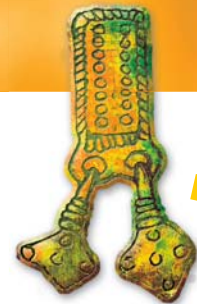
Чудской экспорт. 1, 2 — шумящие привески. Бронза; 3 — топоры. Железо