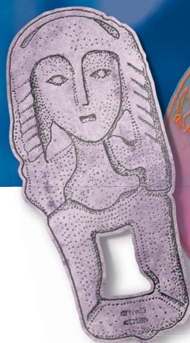
Скульптурный женский портрет. Бронза. V—VIII вв. н.э. Шаманский Мыс (Томская обл.)