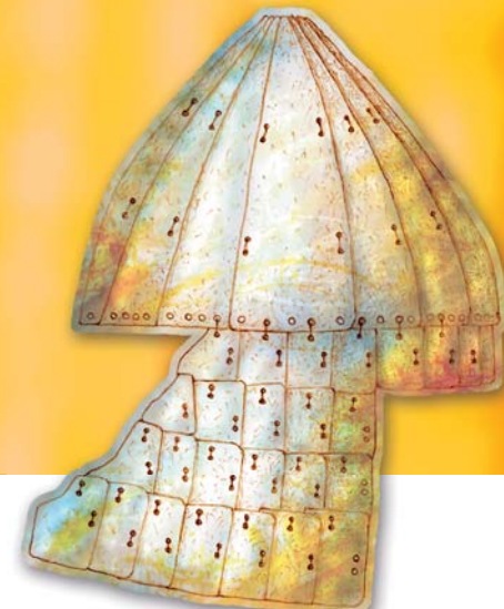
Железный шлем. Южные угры. Первая половина I тыс. н.э. Исаковский могильник (Омская обл.). Реконструкция Л.И. Погодина.

очертания. С приближением души Ньюляка обрело вид человекоподобного призрака.