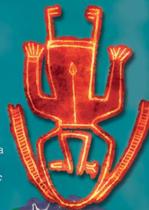
Убитый обско-угорский богатырь. Гравировка на блюде. Вторая половина 1 тыс. н. э., р. Сосьва (Свердловская обл.)