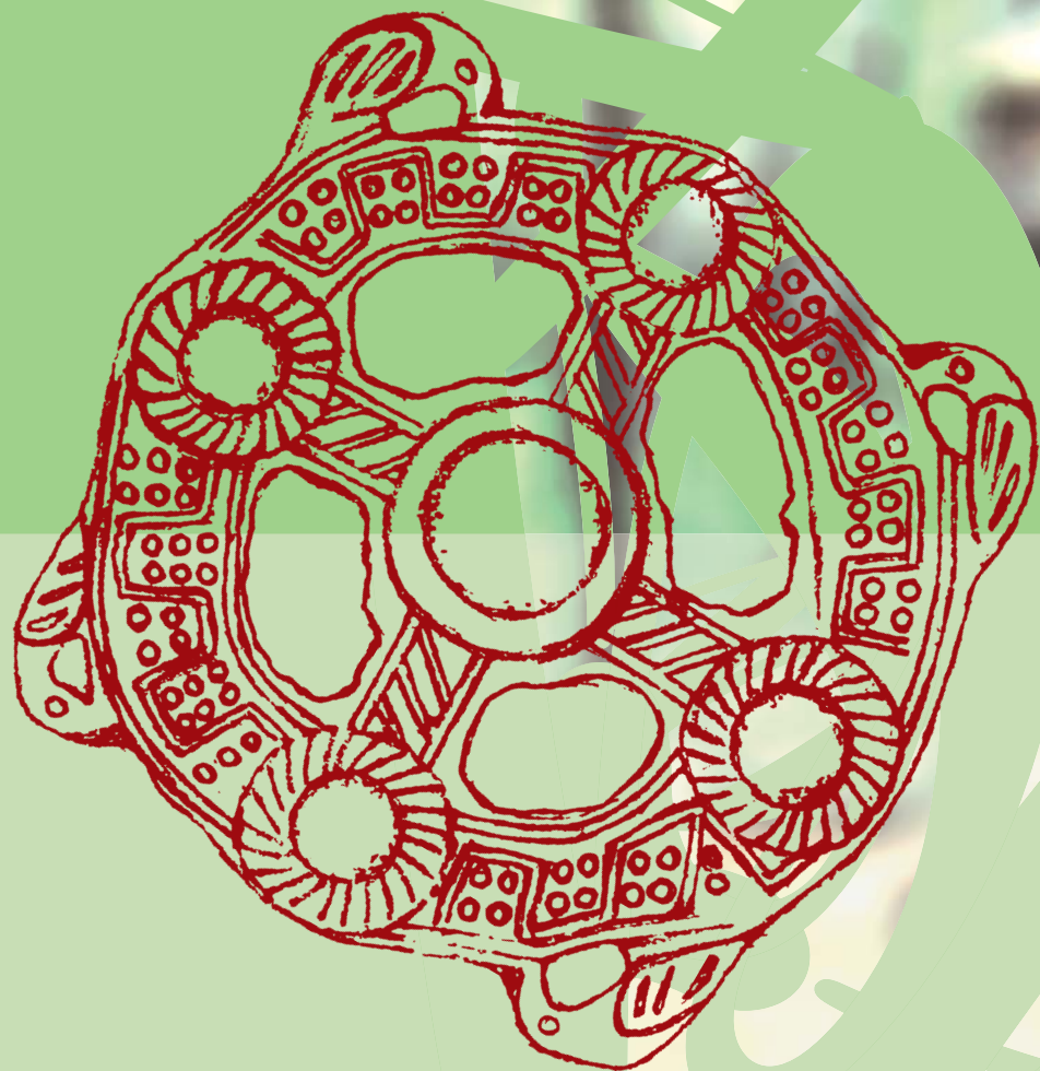
Схема мироздания. Бронза, VI—IX вв. н. э. Релкинский могильник в Среднем Приобье (Томская обл.)