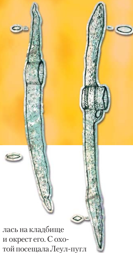
Железные клевцы. IV—V вв. н.э. Парабельский клад (Томская обл.)

лась на кладбище и окрест его. Сохотой посещала Леул-пугл и дом, где прежде жил Ньюляк. По приходе укрывалась в кукольном подобии умершего, наблюдала за близкими, слушала их разговоры, узнавала новости. Потом стало одолевать усугубляющееся тоскливое разочарование. Домашние жили живой жизнью, избегали говорить о мертвых, страшились болезни и смерти, неустанно ограждали себя от соприкосновения с темными силами. При всем внимании к заместительному двойнику, никто из родичей не испытывал любви к нему, а лишь почтительный страх. Вначале пар и запах, исходившие от горячей пищи, доставляли сытость и удовлетворение, затем стали раздражать, особенно когда вдова Ньюляка, обремененная домашними делами, стала опаздывать с жертвенным кормлением, ставя перед идолом, вмещающим илт ее мужа, остывшую еду.