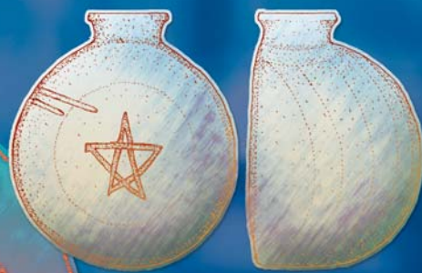
Глиняная посуда из погребений южноугорской знати. II—IV вв. н.э. Сидоровский могильник в Среднем Прииртышье (Омская обл.)

Выкрики были все тише, речь все бессвязней. Снова наступила тишина. Темное безмолвие длилось весьма долго. Владеющий веслом успел бы достичь запертого моста и вернуться обратно. Присутствие шамана не ощущалось. Казалось, его нет здесь или он мертв.