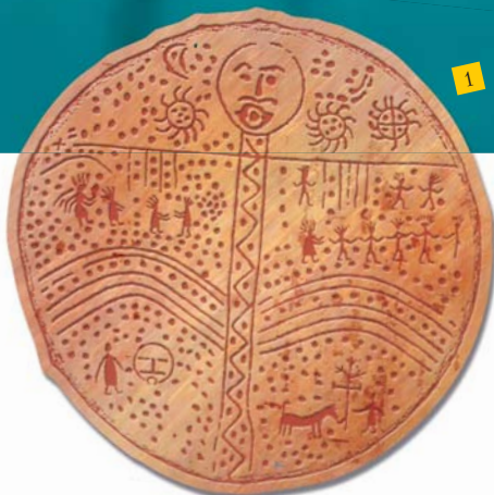
Шаманские бубны: 1 — алтайский, 2 — кетский