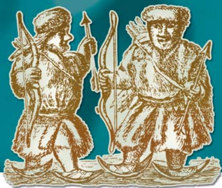
Северные самоеды (касы).