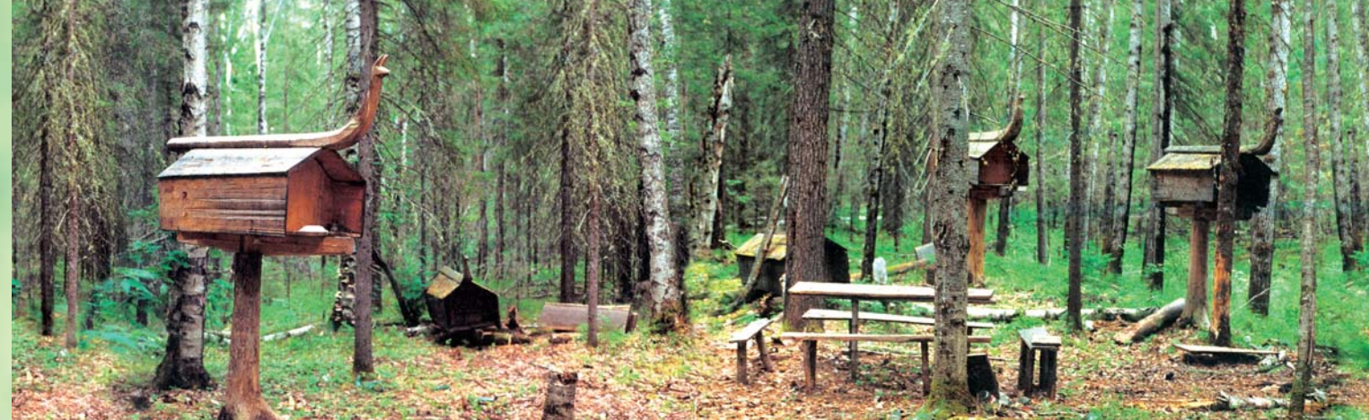
Культовое место Мис-хум-ойки.