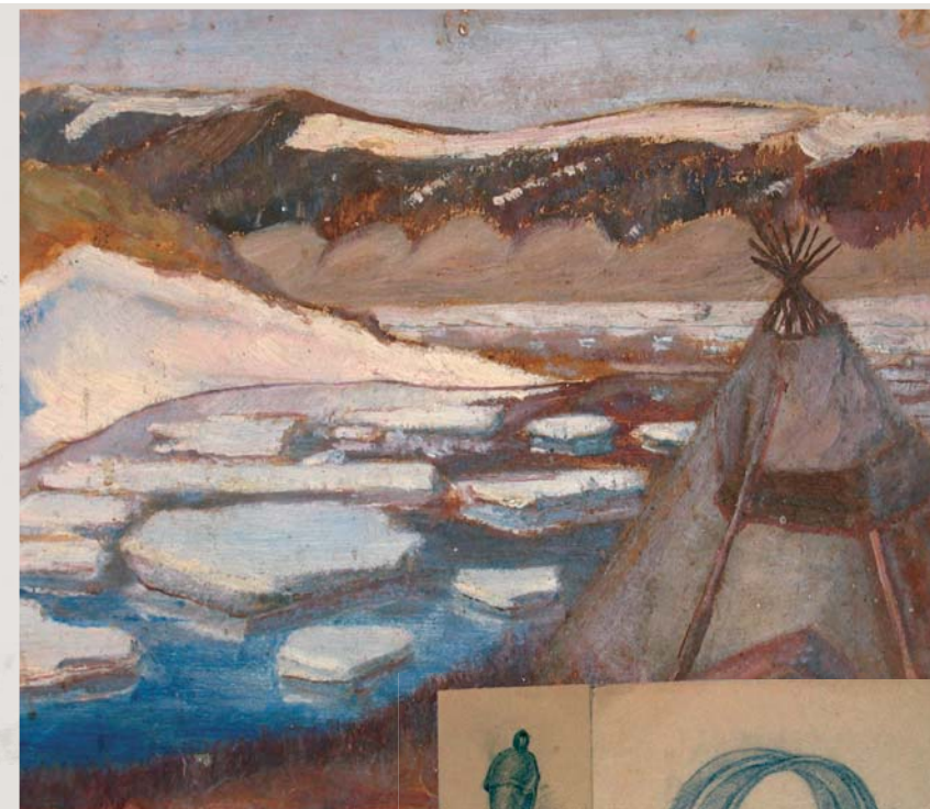
Из таких бесценных листков и сложился «четырнадцатизэтажный» архив ученого