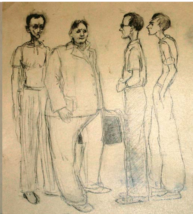
А. П. Окладников. Рисунок В. Д. Запорожской