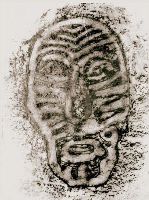
Прорисовка личины с амурских писаниц, выполненная Окладниковым. Сикачи-Алян. 1963 г.

Опубликованная часть научного наследия Окладникова — лишь вершина айсберга. Огромная, интереснейшая часть до сих пор скрыта «под водой» — в бесконечных рабочих записях, таблицах, схемах (они помогали Алексею Павловичу систематизировать почти непредставимый по своей величине объем информации, хранившийся в его памяти), в клочках бумаги, исчерканных карандашными пометами. Прибавьте сюда лекции, доклады, так и не вышедшие в свет, бесчисленное множество черновиков статей, дающих захватывающую возможность — проследить развитие мысли ученого, побывать на его творческой кухне.