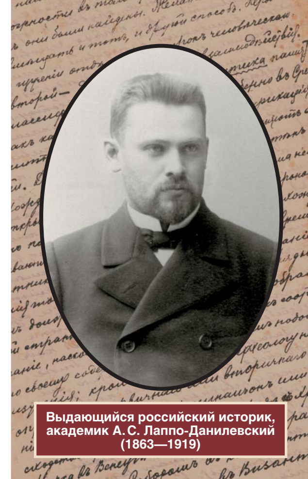
Выдающийся российский историк, академик А. С. Лаппо-Данилевский (1863—1919)

Что было известно о деятельности выдающегося русского историка академика А. С. Лаппо-Данилевского в археологии? Разве что авторы некрологов А. И. Маркевич и И. М. Гревс упоминали о его привязанности и интересу к этой науке. Специалистам по раннему железному веку были хорошо известны его работы «Скифские древности» и «Древности кургана Карагодеуашх». Между тем, понять общетеоретические взгляды на археологию выдающегося источниковеда стало возможным только при обращении к документам его личного фонда, хранящегося в ПФА РАН.