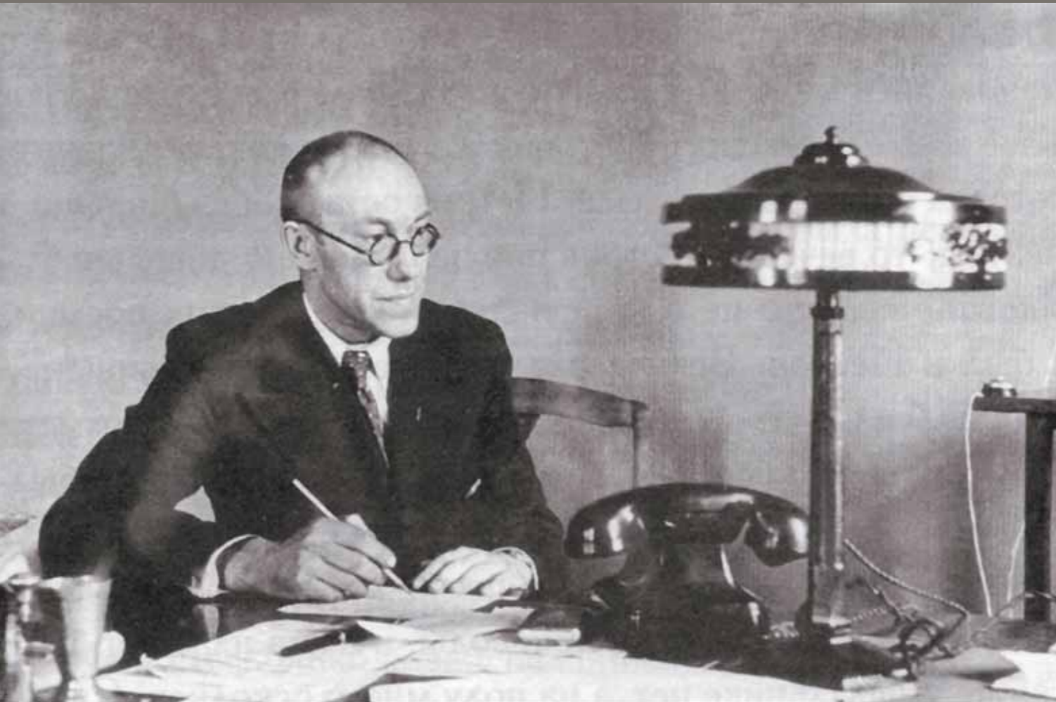
М.А. Лаврентьев – вице-президент АН УССР. 1948 г.