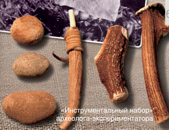
Каменные орудия — бифасы, — вышедшие из современных «умелых рук»