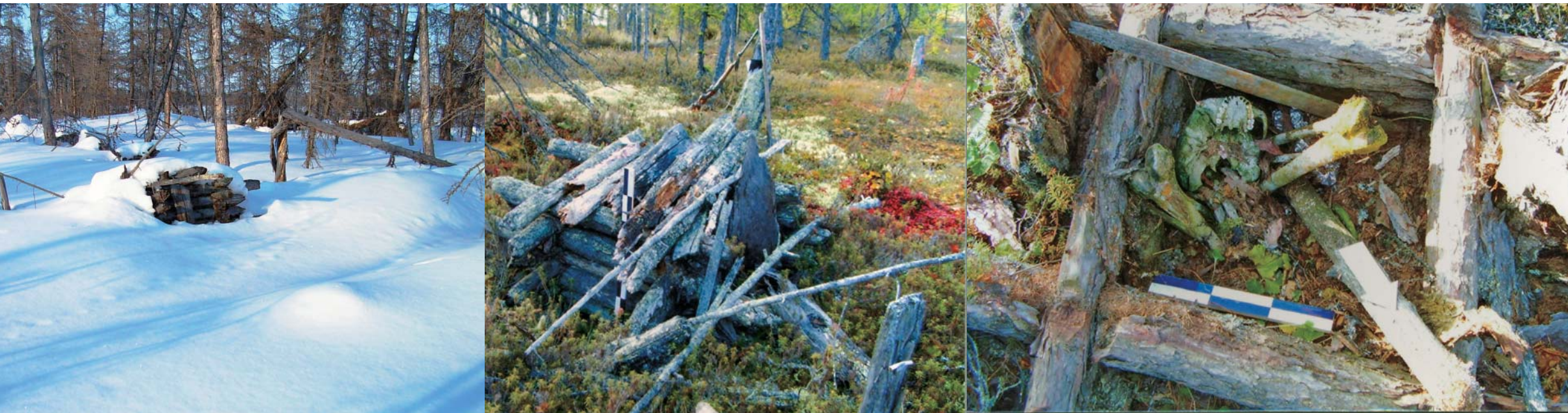
На берегу оз. Омук-Кюель находится могила «шайтана» – небольшой бревенчатый сруб, втиснутый меж двух старых пней и закрытый сверху настилом из жердей. Необычно маленькие размеры погребальной камеры (0,45х0,45 м) и расположение костей дают основание предполагать, что захоронены были останки мумифицированного человека