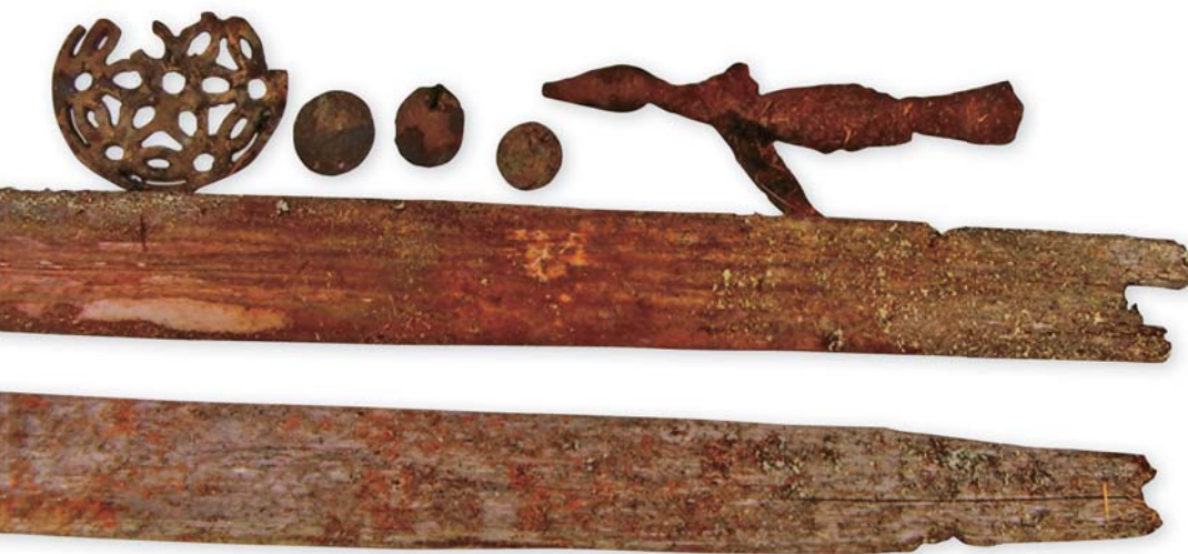
В захоронении «шайтана» обнаружены части шаманского облачения: фигурка гагары, соляный диск с ажурным плетением, три монеты-жетона. Справа – пояс шамана с подвесками, среди них соляный диск. Музей археологии и этнографии ИАЭТ СО РАН (Новосибирск)