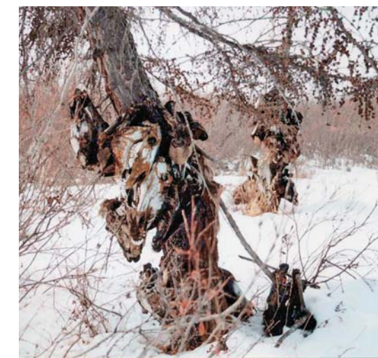
Работа выполнена в рамках Программы Президиума РАН «Историко-культурное наследие и духовные ценности России», блок «Духовная культура саха: традиции, современное состояние и перспективы развития»

Саха считают, что душа покойника отправляется в загробный мир верхом на коне. Следуя старинному обычаю, уходящему корнями в древнетюркскую эпоху, жители с. Алеко-Кюель до сих пор забивают на похоронах жертвенных лошадей, а их головы и копыта вешают на деревьях около кладбища. Головы лошадей ориентированы на восход солнца, в сторону местожительства светлых божеств айыы . Дерево, в данном случае лиственница, выступает связующим звеном между мирами, «дорогой» в потусторонний мир