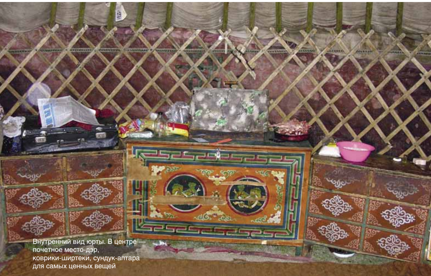
Внутренний вид юрты. В центре — почетное место-дэр, коврики-ширтеки, сундук-аптара для самых ценных вещей