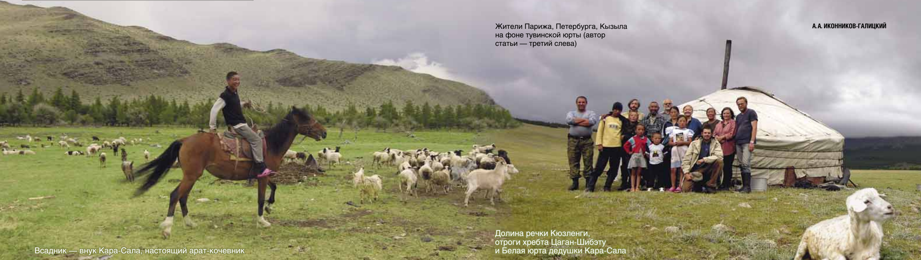
Всадник — внук Кара-Сала, настоящий арат-кочевник