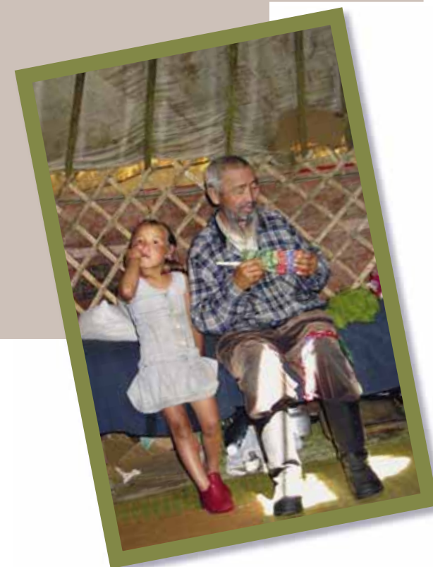
Детям в тувинской юрте дозволено все

Да, чуть не забыл сказать: юрта Кара-Сала стоит прямо на кургане. Если через очаг его жилища провести вертикаль, соединяющую мир живых, мир мертвых и мир божественных духов, то она пройдет и через погребение воина-скотовода, умершего две с половиной тысячи лет назад. Действительно, в Туве сливаются воедино времена и эпохи.