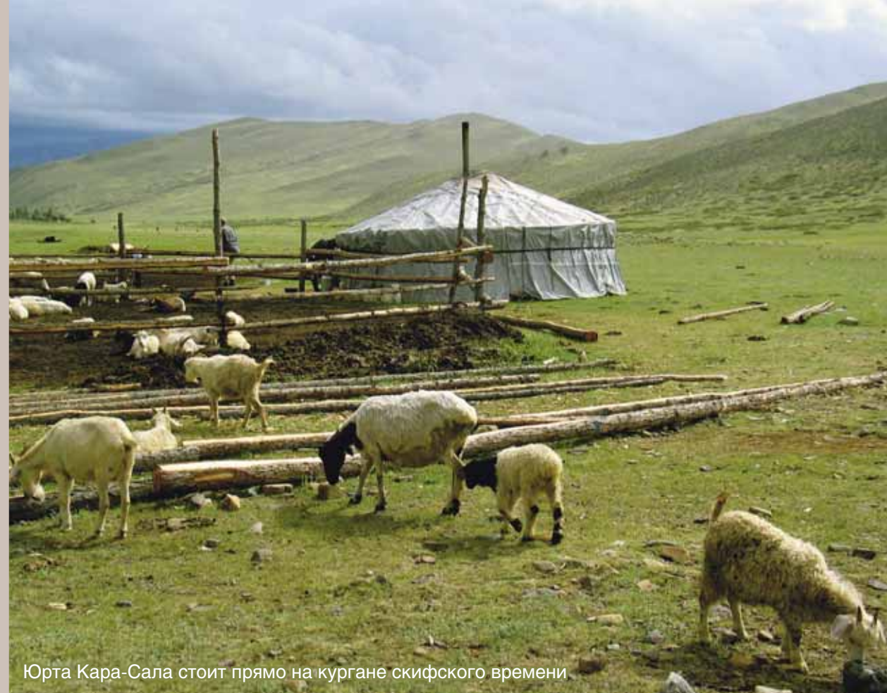
Юрта Кара-Сала стоит прямо на кургане скифского времени

узелки на которых сплетены точно таким манером, как это делали древние скифы две с половиной тысячи лет назад. Вещи из той эпохи. Взять их в руки почти так же удивительно, как увидеть живого мамонта.