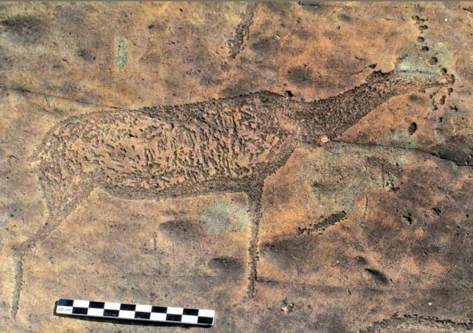
Петроглифы. Плато Укок, Горный Алтай.