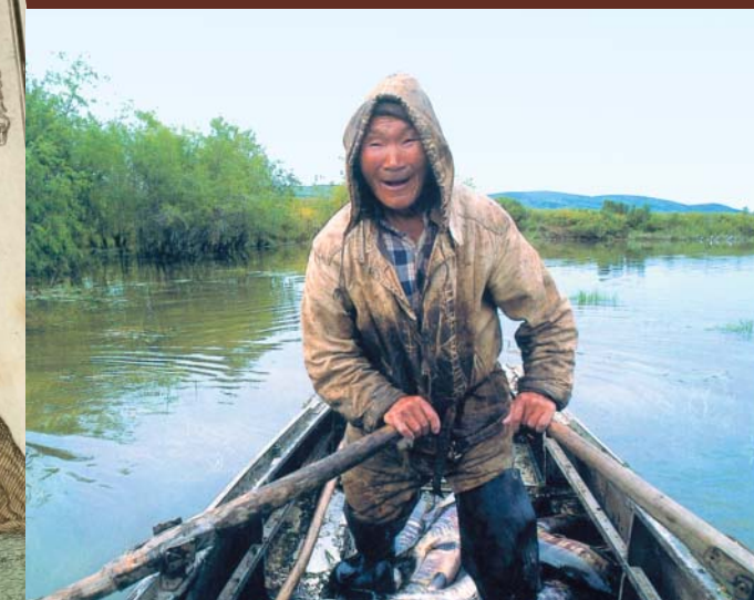
Рыбный промысел — одно из основных занятий коряков.