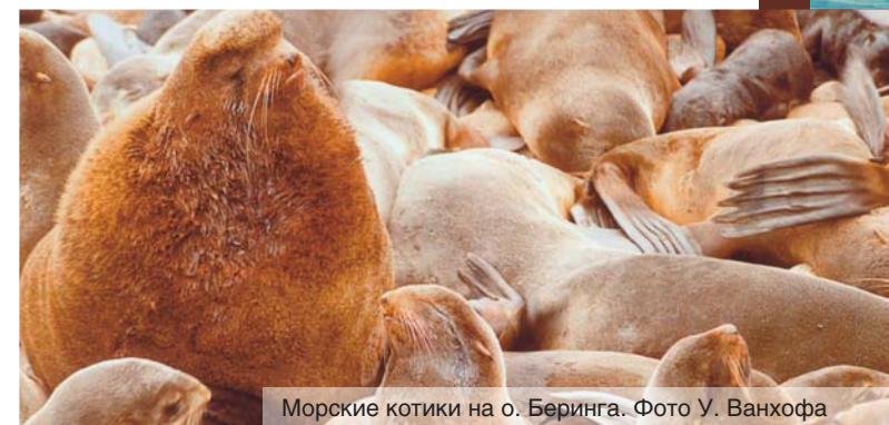
Морские котики на о. Беринга.

Когда размышляешь о ней, невольно вспоминаешь «Железную волю» Лескова. Георга Стеллера вряд ли можно назвать двойником Гуго Пекторалиса, Стеллер слишком жизнерадостен и бесшабашен для этого. Но сам образ немецкого «железа», намертво вязнувшего в русском «тесте», многое может объяснить. И лежит это как-то вне оценочных характеристик: «Железо хорошо, а тесто плохо», или наоборот. Всему свое время и свое место. Неслучайно и то, что лесковская повесть была