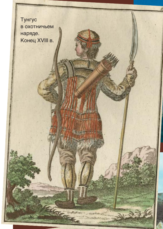
Тунгус в охотничьем наряде. Конец XVIII в.

В августе 1744 года Стеллер почел свою миссию выполненной и через Охотск и Якутск поехал обратно. В столицу.