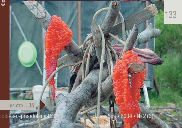
на стр. 135