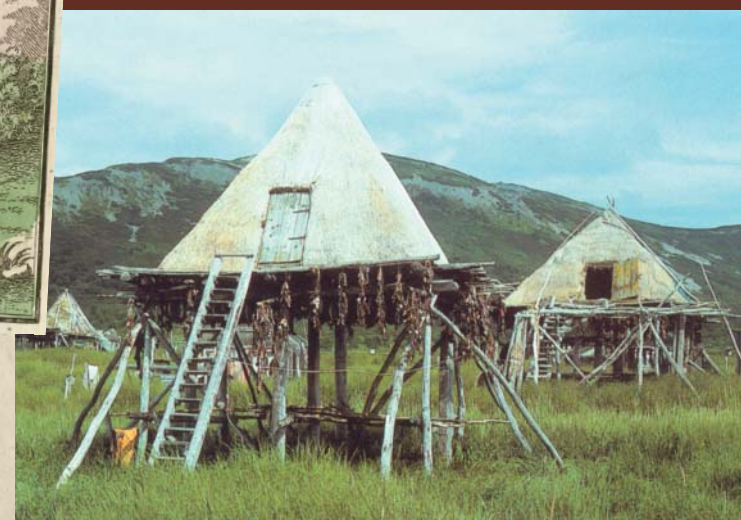
Летние жилища современных ительменов Камчатки.