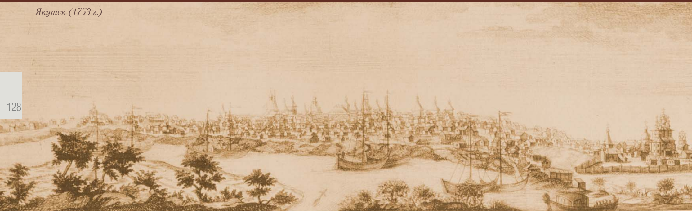
Якутск (1753 г.)

молочные каналы, содержащие большое обилие молока, превосходящего своею сладостью и содержанием жира молоко животных, живущих на земле, в остальном же вполне схожего с ними...»