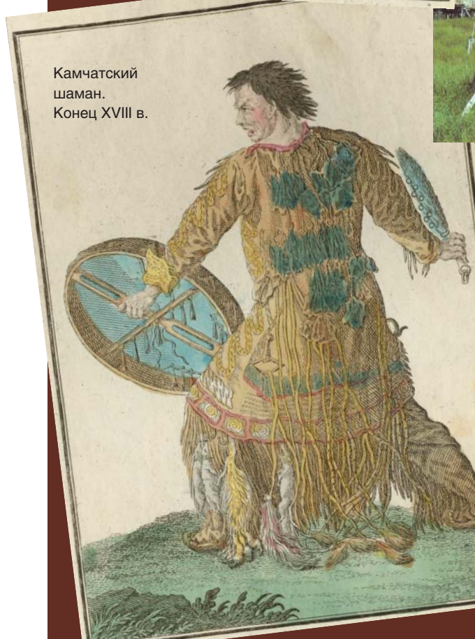
Камчатский шаман. Конец XVIII в.