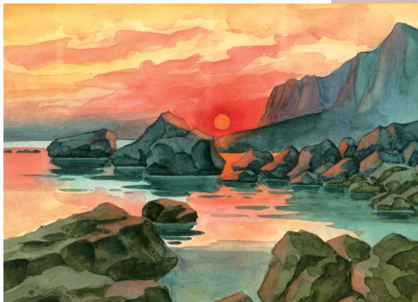
Закат за Батилиманом и мысом Айя. 18.10.1978 г.

И вот готова научная монография — «Этюды радиоуглеродной хронологии Херсонеса Таврического». Помимо «вольного» названия, книга замечательна еще одним моментом — в ней, между двумя научными частями, опубликована большая поэма «Херсонес—Корсунь—Херсон». Факт, почти неслышанный в российской науке. Со времен ломоносовского «Письма о пользе стекла» — поэмы, означенной 1752 годом, ученые не покушались на симбиоз поэтического и научного.