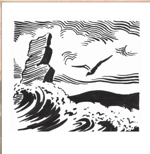
Шторм. 1972 г.

Рецепта нет. Решает каждый сам, В чем радость жизни и ее краса.