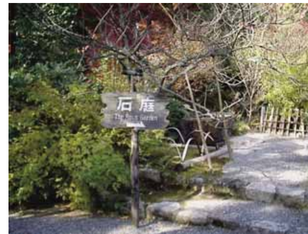
Вход в Сад камней — место для философских размышлений

Человечество хочет получить ответ на главные вопросы: являются ли наблюдаемые изменения климата результатом хозяйственной деятельности людей и имеет ли природа достаточный запас прочности противостоять такому вмешательству? Дискуссии этой посвящено столь большое число научных и газетных публикаций, серьезных экономических документов и политических протоколов, что вряд ли имело бы смысл еще раз обращаться к этой теме, если бы не острота и важность проблемы, вставшей перед учеными нашей страны.