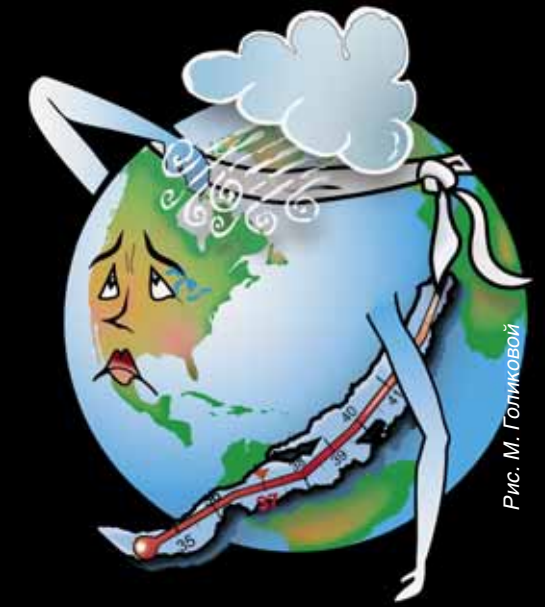
Рис. М. Голиковой

Дело в том, что после жарких споров Россия приняла Киотский протокол , который вступил в действие 16 февраля 2005 г. Этот международный договор регламентирует деятельность стран в области выбросов так называемых парниковых газов и нацелен на сокращение негативного антропогенного влияния на климат. Впервые в истории международных отношений предлагаются конкретные рыночные механизмы в вопросах, касающихся состояния природной среды.