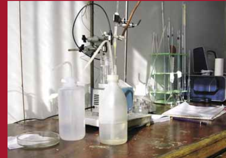
В химической лаборатории на стационаре ЛИН СО РАН в поселке Большие Коты каждые 3 часа делается химический анализ воды