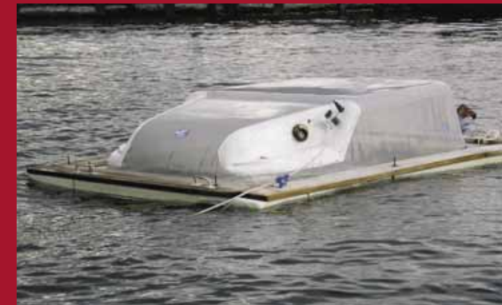
Закрытая камера для измерения ритмов газообмена

Чтобы адаптировать эту методику к условиям водной поверхности, пришлось «научить» камеры уверенно «плавать», разработав ряд приспособлений для удержания их на заданном месте при сильном волнении