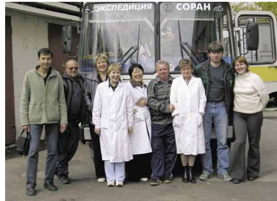
Проводы томских коллег