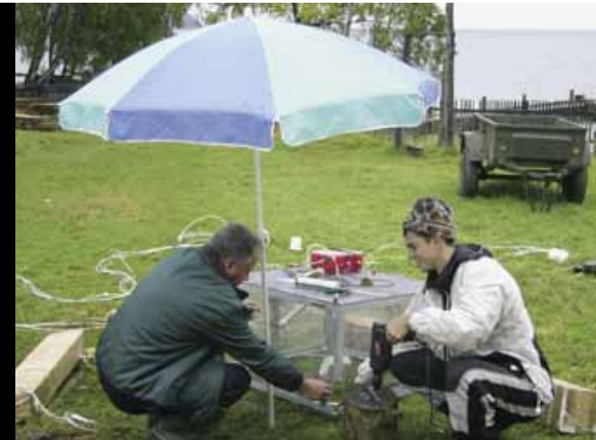
Готовим камеры к заплыву

Однако религия, экономика, политика — это уже не мой профиль. Поэтому лучше вернемся к сути происходящих в природе процессов и к тому, что делают сегодня ученые.