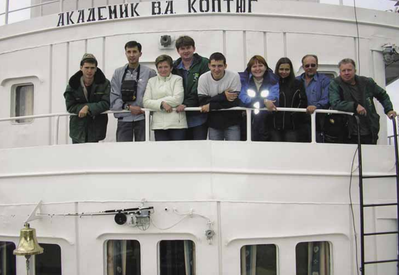
Научно-исследовательское судно флота Лимнологического института на Байкале

(ветровой режим Байкала чрезвычайно изменчив). Правда, даже наши якоря не дают стопроцентной гарантии: несколько камер разбились на прибрежных камнях, да и нам в каждой экспедиции приходилось купаться в холодной байкальской воде.