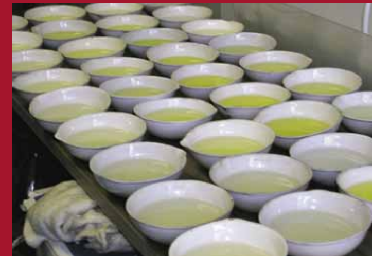
Пробы воды для определения нитратов