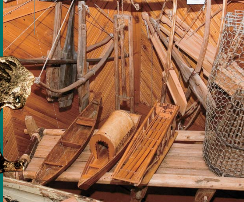
Этнографическая экспозиция Березовского краеведческого музея (ХМАО)