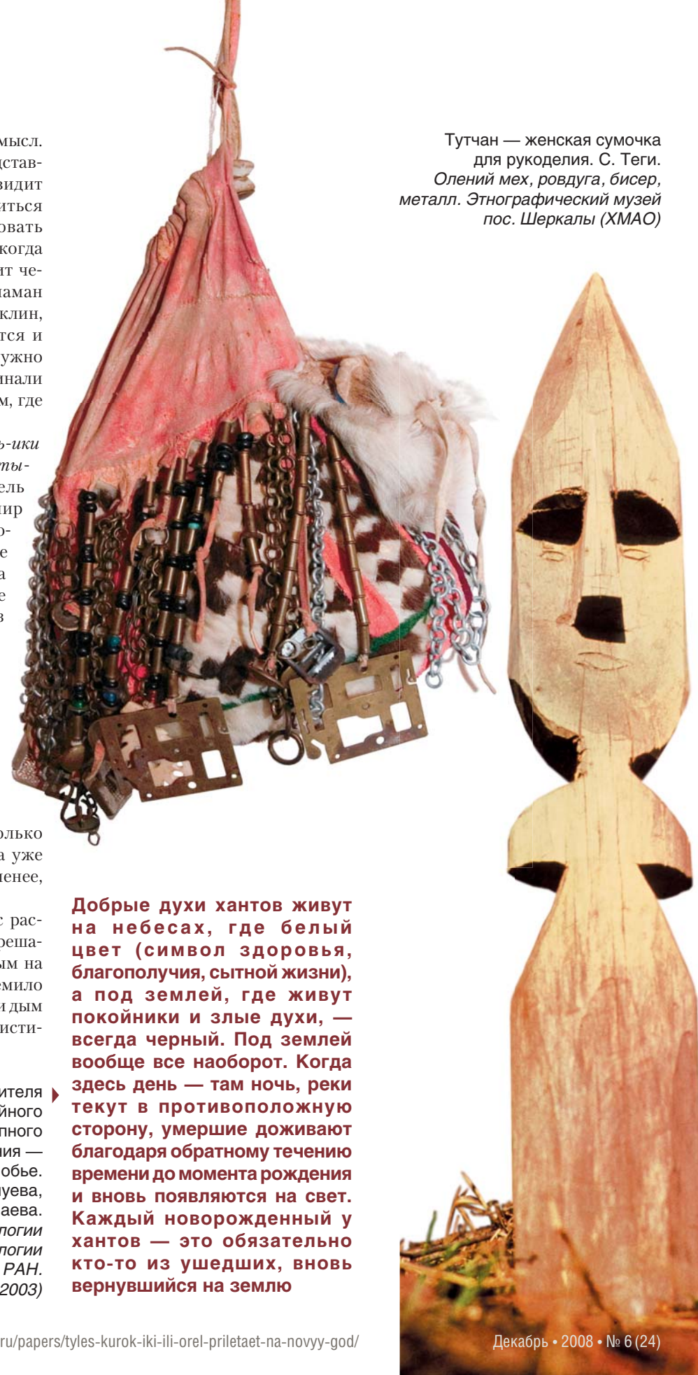
Тутчан — женская сумочка для рукоделия. С. Теги. Олений мех, ровдуга, бисер, металл. Этнографический музей пос. Шеркалы (ХМАО)

Ранг подобного духа-покровителя мог колебаться от семейного божества до покровителя крупного территориального объединения — княжества. Нижнее Приобье. Материалы И. Н. Гемуева, А. М. Сагалаева. Дерево. Музей археологии Института археологии и этнографии СО РАН. По: (Соловьев, 2003)