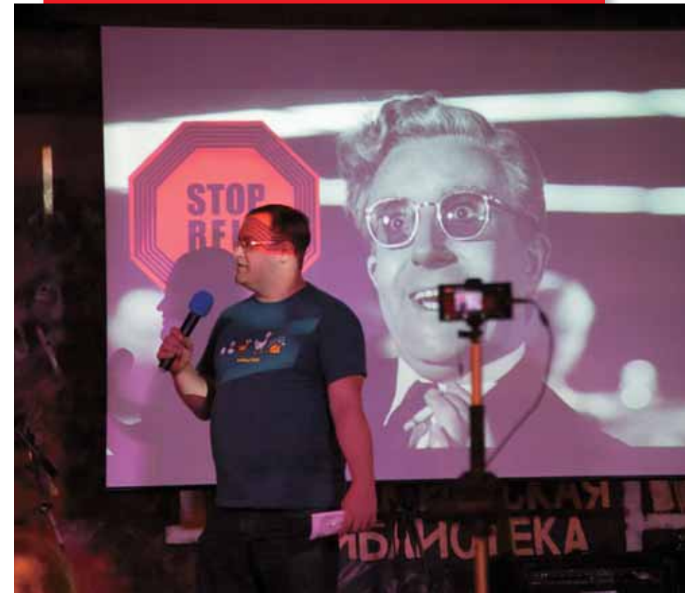
Фото А. Танюшина (Новосибирск)

По: ( https://echo.msk.ru/blog/metkere/2089260-echo/ )