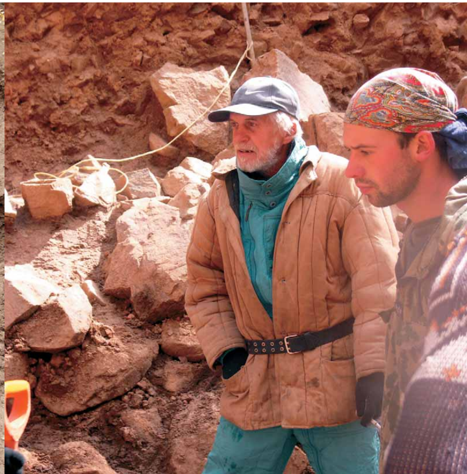
Первые находки – зонтик китайской колесницы. Художник В. Ефимов, участник экспедиции Е. Говорков. Осень, 2006 г. Курган 20