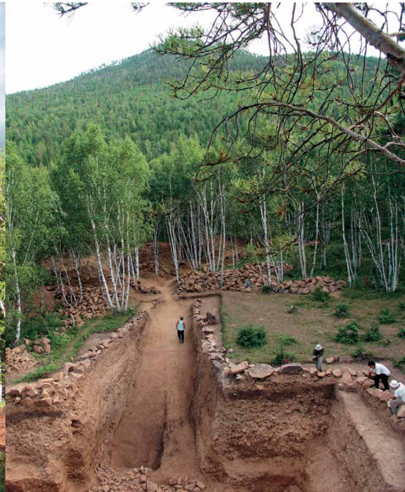
Начало работ. Лето, 2006 г. Курган 20