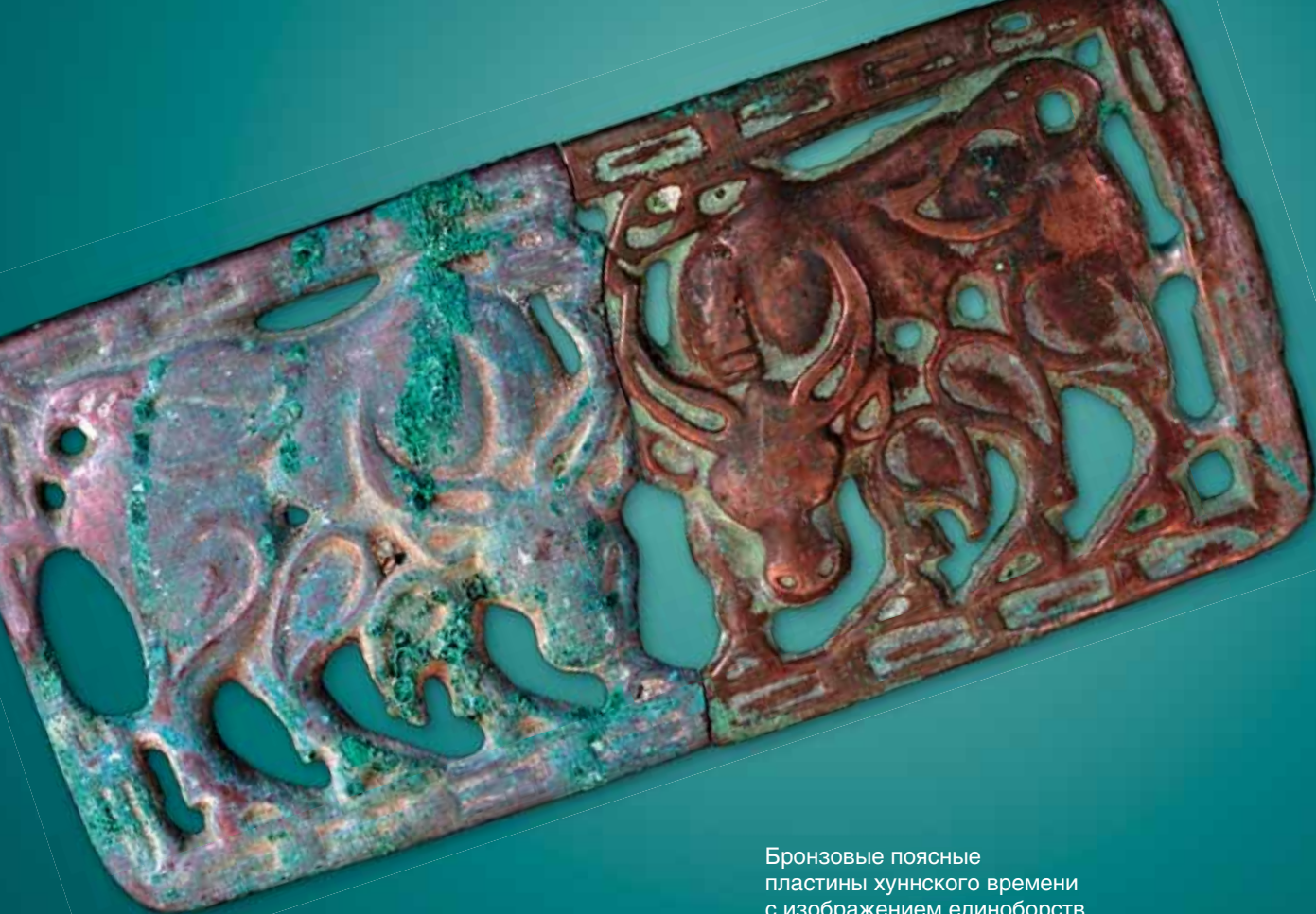
Бронзовые поясные пластины хуннского времени с изображением единоборств быков. (Конец I тыс. до н.э.) Июсский клад

рукоятки воспринимается в «правильном положении» лишь при расположении кинжала в ножнах на поясе, т.е. клинком вниз.