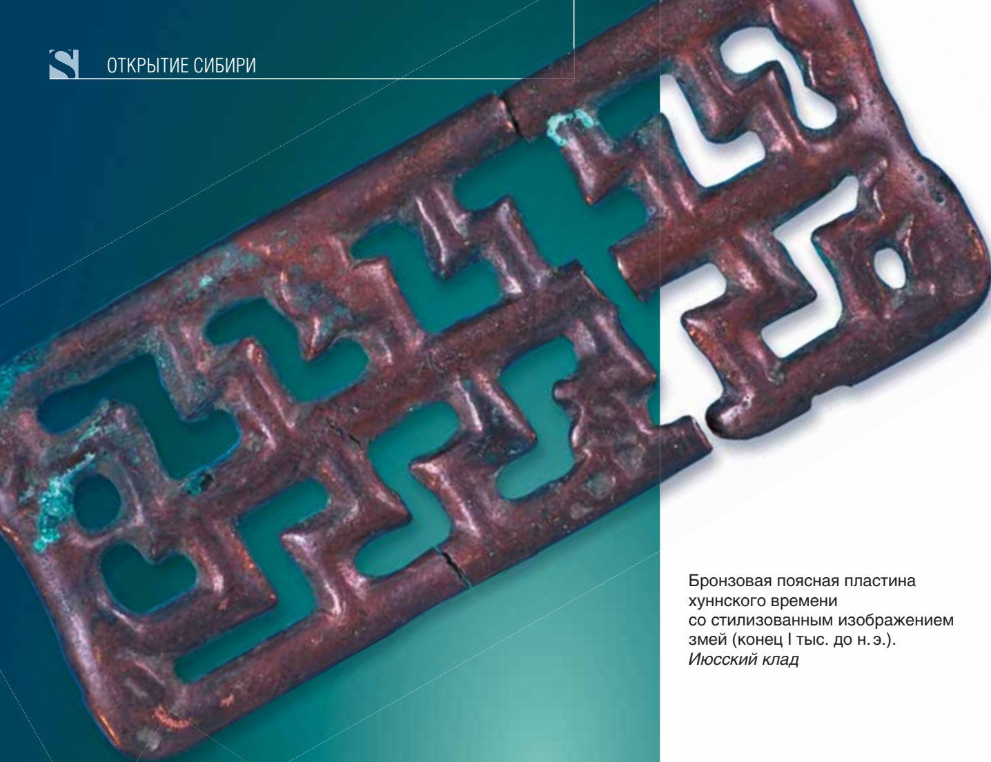
Бронзовая поясная пластина хуннского времени со стилизованным изображением змей (конец I тыс. до н.э.). Июсский клад

Все четыре бронзовых кинжала, вероятно, связаны с культовыми местами эпохи раннего железа на юге Западной Сибири. Основанием для такого предположения может служить несколько фактов из археологических и письменных источников скифской эпохи.