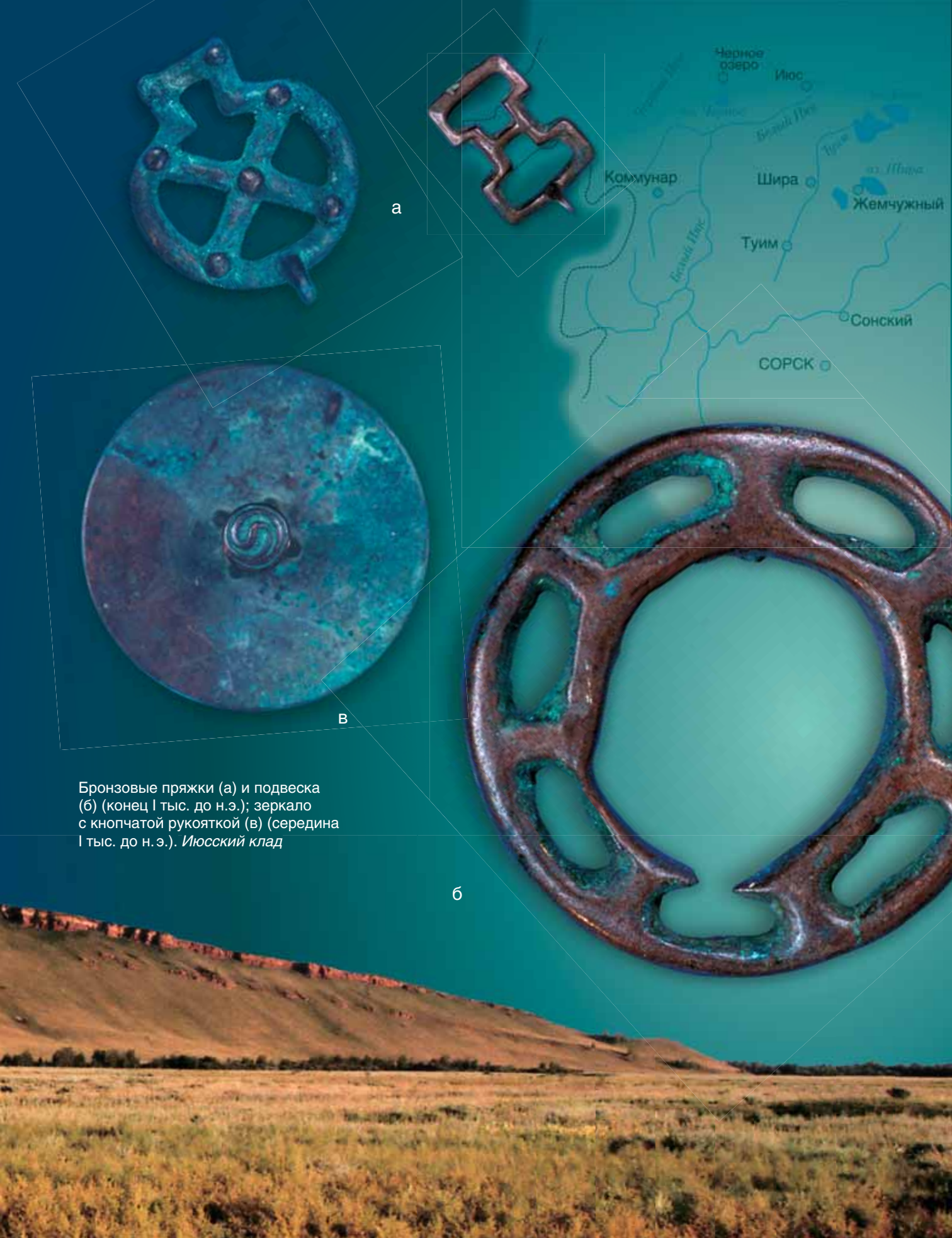
Бронзовые пряжки (а) и подвеска (б) (конец I тыс. до н.э.); зеркало с knobчатой рукояткой (в) (середина I тыс. до н.э.). Июсский клад

На обширных территориях Южной Сибири от Среднего Енисея до Верхней Оби обнаружены десятки кладов, и среди них — Июсский , состоящий из многочисленных бронзовых предметов искусства тагарской эпохи