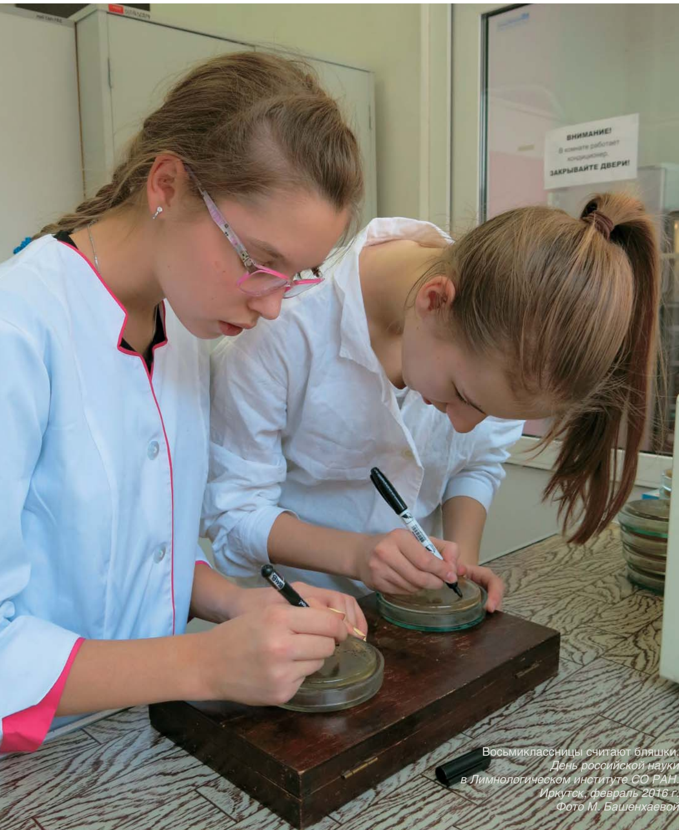
Восьмиклассницы считают бляшки. День российской науки в Лимнологическом институте СО РАН. Иркутск, февраль 2016 г.

Р еформа РАН была нужна, это теперь признают практически все. С тех пор много времени прошло, реформировалась и реформа. Будет ли достигнута ли ее цель?