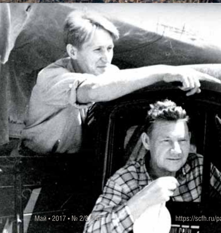
У Шишинских скал с местными ребятами, 1976 г.