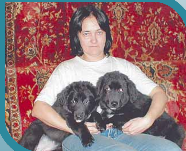
Щенки Тыргак и Майнак.

к местным условиям пастушеско-сторожевые собаки всегда будут там необходимы.