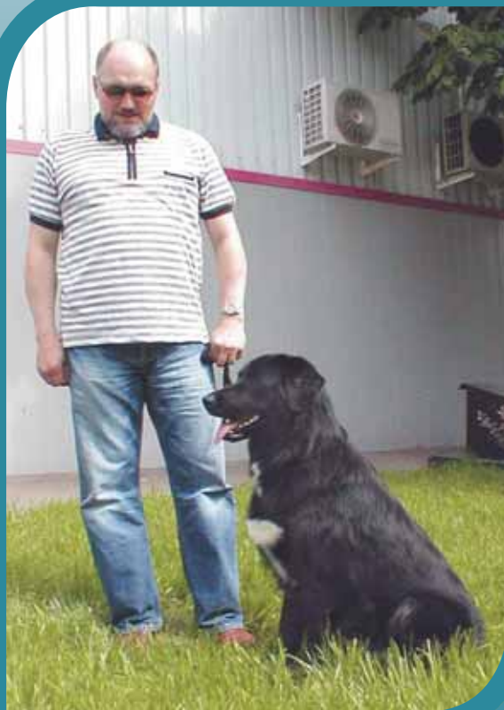
Тыргак с хозяином на выставке.

в Москве в 2001 году и затем неоднократно выставлялась на выставках Союза кинологических организаций России. 5 собак получили оценки «отлично». Привезенный из Монгун-Тайгинского кожууна (района) кобель по кличке Мугур (сейчас ему 5 лет) признан чемпионом России.