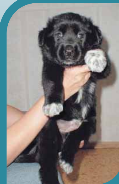
Первые московские «дети».

ЗАХАРОВ Илья Артемьевич — доктор биологических наук, член-корреспондент РАН, с 1992 г. заместитель директора Института общей генетики РАН, профессор МГУ. Автор около 200 статей и 12 книг. Область научных интересов — генетика животных, эволюционная генетика, история генетики