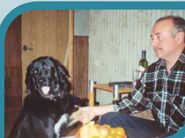
Мугур с хозяином в Москве.

В качестве новой породы, тувинская овчарка была представлена