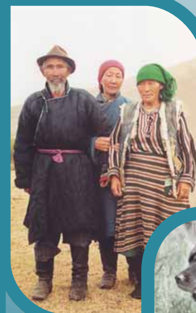
Животноводы, у которых рос Мугур, будущий чемпион России.

ЗАХАРОВ Илья Артемьевич — доктор биологических наук, член-корреспондент РАН, с 1992 г. заместитель директора Института общей генетики РАН, профессор МГУ. Автор около 200 статей и 12 книг. Область научных интересов — генетика животных, эволюционная генетика, история генетики